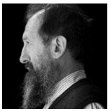
› Michele De Lucchi