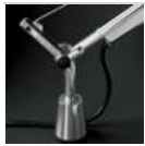
TOLOMEO SUPP. TAVOLO FISSO