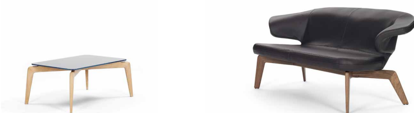
MUNICH COFFEE TABLE 2010