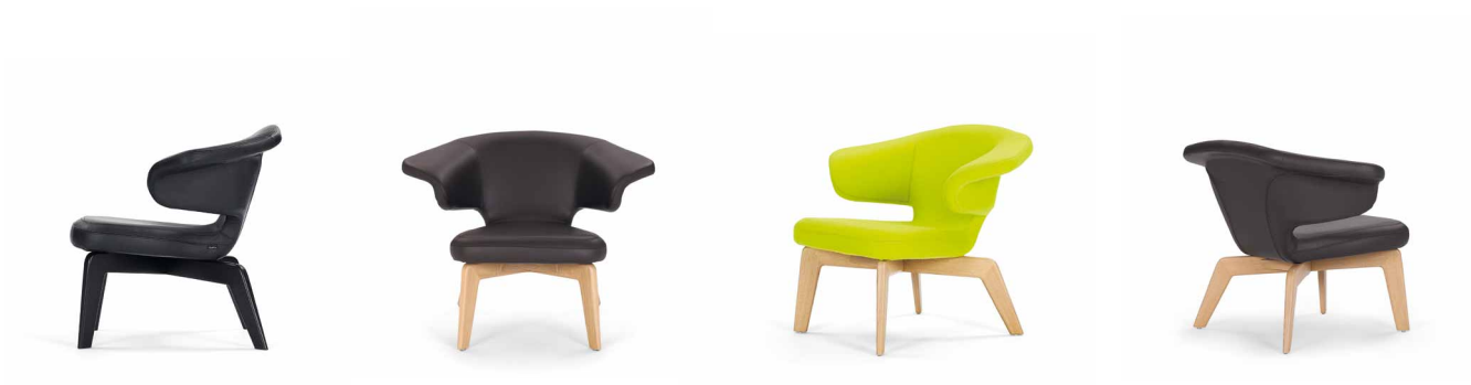
Munich Lounge Chair

Estructura de madera con una capa de laca transparente o barnizado en negro. Estructura de tubos de acero con bandas de goma y poliuretano rígido. Acolchado de poliuretano con poliéster. Tapicería de tela o piel. Detalles, colores y normas europeas probado ver lista de precios.