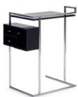
PETITE COIFFEUSE 1929