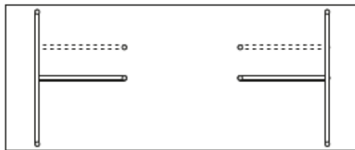
wahlweise mittig/exzentrisch montierbar