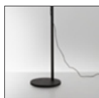
Demetra Supporto F NRO 1741040A