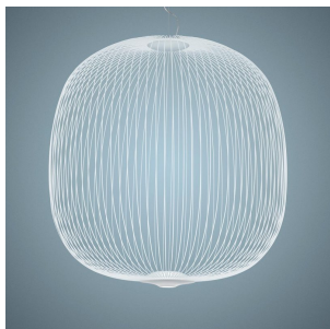
Spokes 2 Large