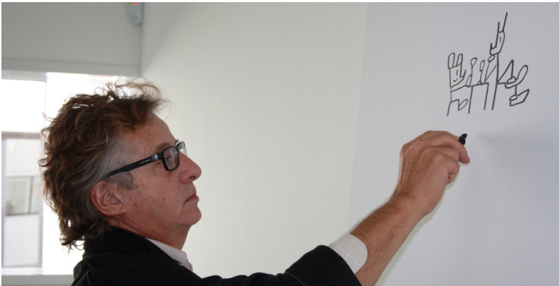
Designer bei Magis

Jahreszeiten repräsentieren: grün (Frühling), orange (Sommer), braun (Herbst) und weiss (Winter).