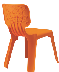
Matt colour Yellow 1037 C