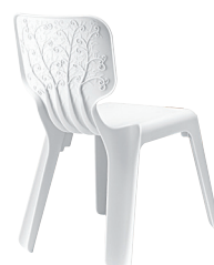
Matt colour White 1690 C