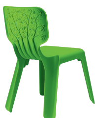
Matt colour Green 1342 C