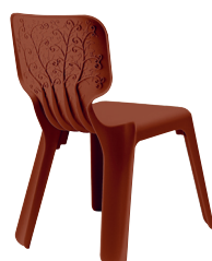
Matt colour Brown 1478 C