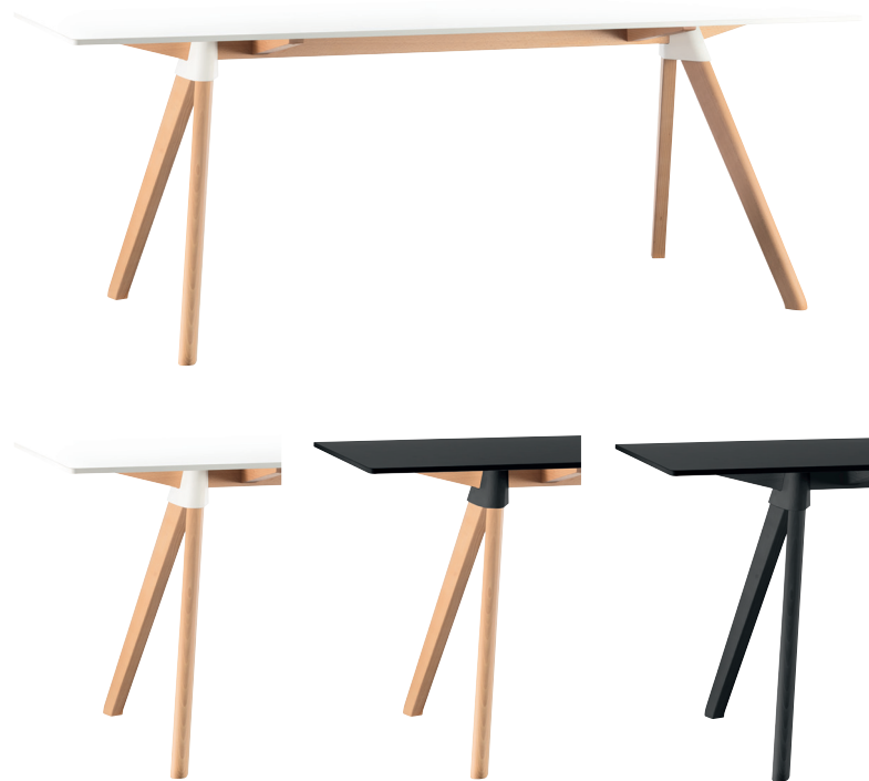
Frame: Natural beech Joint: White 1735 C Top: White 8500