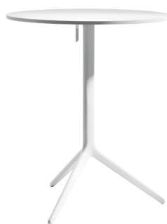
Outdoor use Frame: White 5108 Top: White 8500