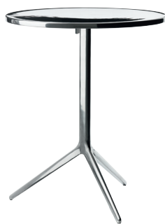
Indoor use Frame: Polished Top: Polished Only for ø60