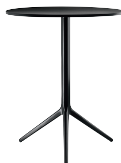
Outdoor use Frame: Black 5140 Top: Black 8510