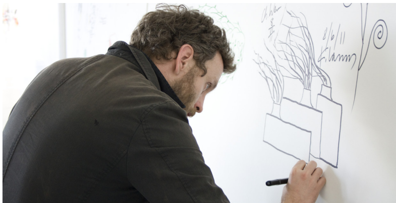
Designer bei Magis