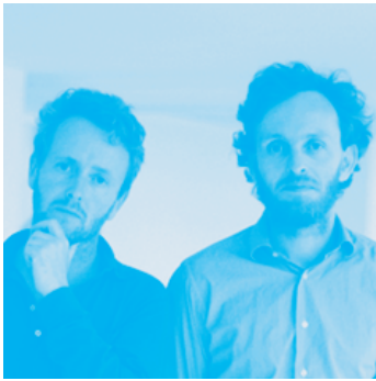
Ronan & Erwan Bouroullec

Ronan Bouroullec und Erwan Bouroullec arbeiten seit fast fünfzehn Jahren zusammen, ein ständiger Dialog, der durch zwei unterschiedliche Persönlichkeiten und das gemeinsame Bemühen um behutsame Ausgewogenheit bereichert wird. Seit 2004 arbeiten die Brüder Bouroullec auch mit Magis zusammen und designten mit Striped und Steelwood zwei komplette Kollektionen, ausserdem verschiedene Stühle und Tische sowie 2014 die neue Kollektion Officina.