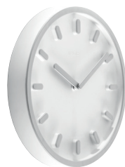
Matt colour Clock face: White 1735 C Hands, hour marks and frame: Grey 1737 C