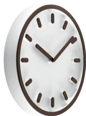
Matt colour Clock face: White 1735 C Hands, hour marks and frame: Brown 1070 C