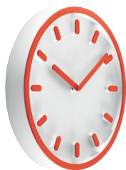
Matt colour Clock face: White 1735 C Hands, hour marks and frame: Orange 1086 C