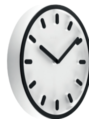
Matt colour Clock face: White 1735 C Hands, hour marks and frame: Black 1750 C