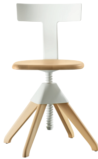
Seat + Frame: Natural beech Back + Joint: White 1735 C