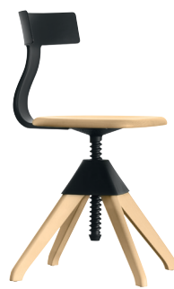
Seat + Frame: Natural beech Back + Joint: Black 1754 C