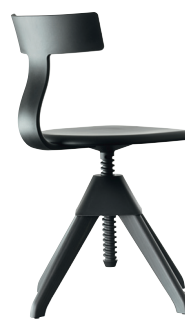
Seat + Frame: Beech painted Black Back + Joint: Black 1754 C