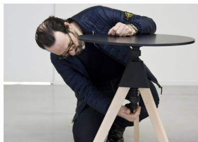
Designer chez Magis