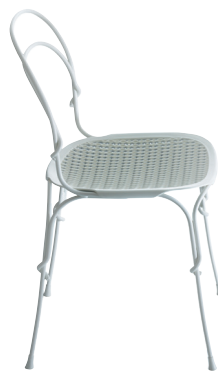
Frame: White 5110 Interlacement: Grey 1417 C + White 1673 C