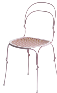
Frame: Warm Grey 5117 Interlacement: Curry 1015 C + Warm Grey 1419 C