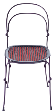
Frame: Purple Violet 5047 Interlacement: Red 1129 C + Purple Violet 1487 C