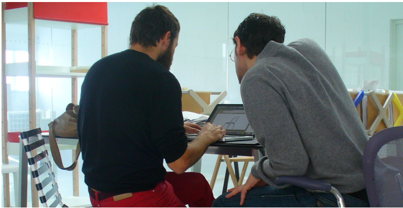
Designer chez Magis

une table ronde avec une torsade de fil qui sert de colonne centrale et deux tables (carrée et rectangulaire) avec quatre pieds reprenant le motif du fil en vrille utilisé pour la chaise.