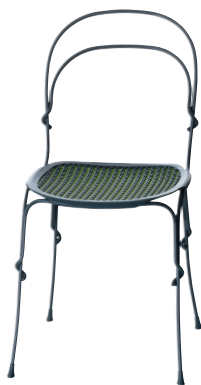
Frame: Granite Grey 5072 Interlacement: Green 1288 C + Granite Grey 1423 C