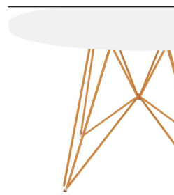
Frame: Copper Top: White 8500 Only for Ø120