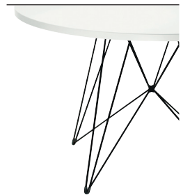
Frame: Black 5140 Top: White 8500