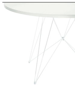
Frame: White 5108 Top: White 8500