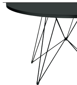
Frame: Black 5140 Top: Black 8510