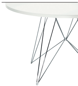
Frame: Chromed Top: White 8500