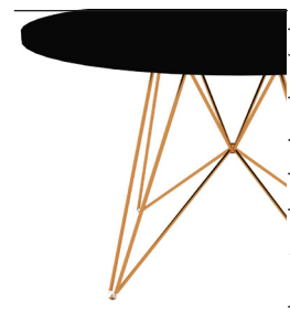
Frame: Copper Top: Black 8510 Only for Ø120