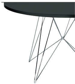
Frame: Chromed Top: Black 8510