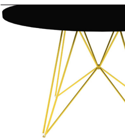
Frame: Gold Top: Black 8510 Only for Ø120