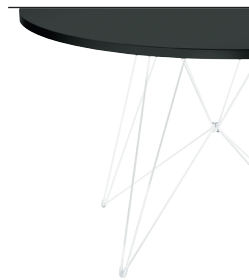
Frame: White 5108 Top: Black 8510