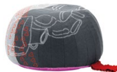
Bovist, Motif "Pottery"

partir de tissus multicolores, une beauté de graphisme exceptionnelle. Une poignée tricotée permet par ailleurs de déplacer Bovist dans l'appartement.