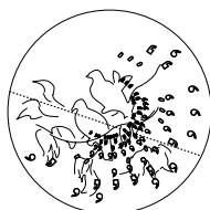
Bovist, Motif "Dove", 540 x 540 x 380 mm