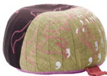
Bovist, Motif "Dove"

Bovist est à la fois un coussin de sol décoratif, un tabouret et un ottoman. Bovist doit sa forme sympathique et son agréable confort d'assise à des revêtements à couture latérale renforcée et à un rembourrage fait de petites billes en matière synthétique. De grandes broderies confèrent au revêtement réalisé, à