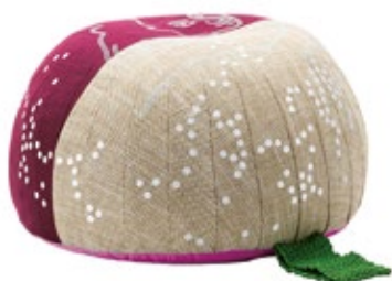
Bovist, Motif "Lacemaker"

Bovist est à la fois un coussin de sol décoratif, un tabouret et un ottoman. Bovist doit sa forme sympathique et son agréable confort d'assise à des revêtements à couture latérale renforcée et à un rembourrage fait de petites billes en matière synthétique. De grandes broderies confèrent au revêtement réalisé, à