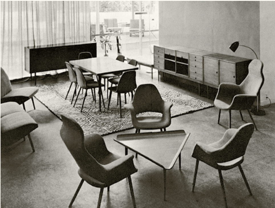
Szene auf der MoMA-Ausstellung «Organic Design in Home Furnishings», 1941