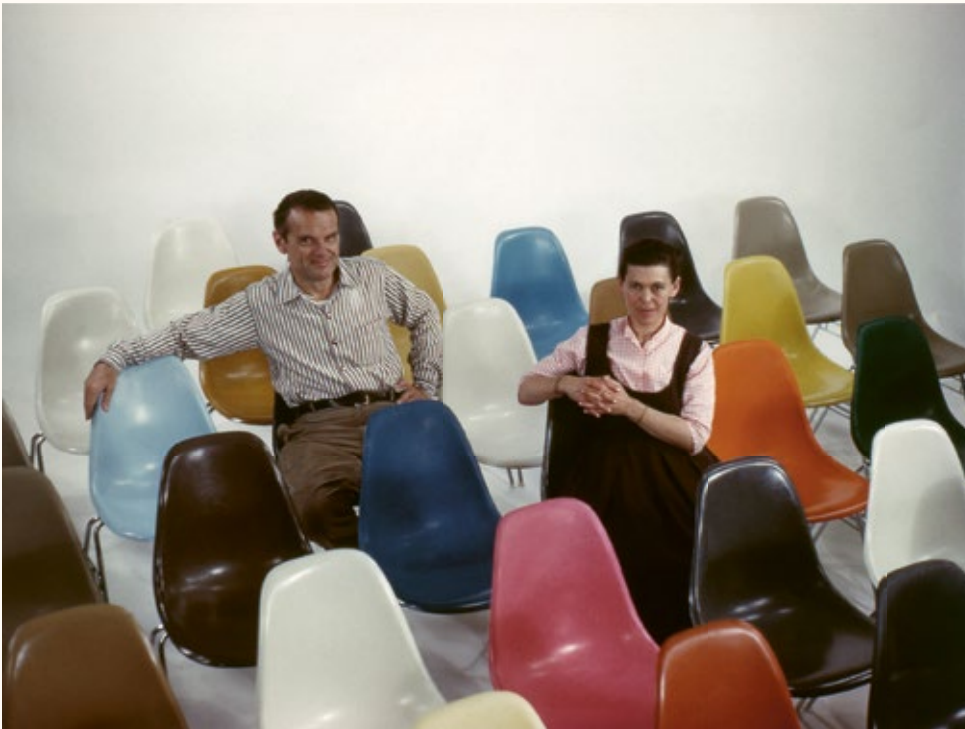
Charles und Ray Eames, auf Eames Fiberglass Chairs sitzend, 1960