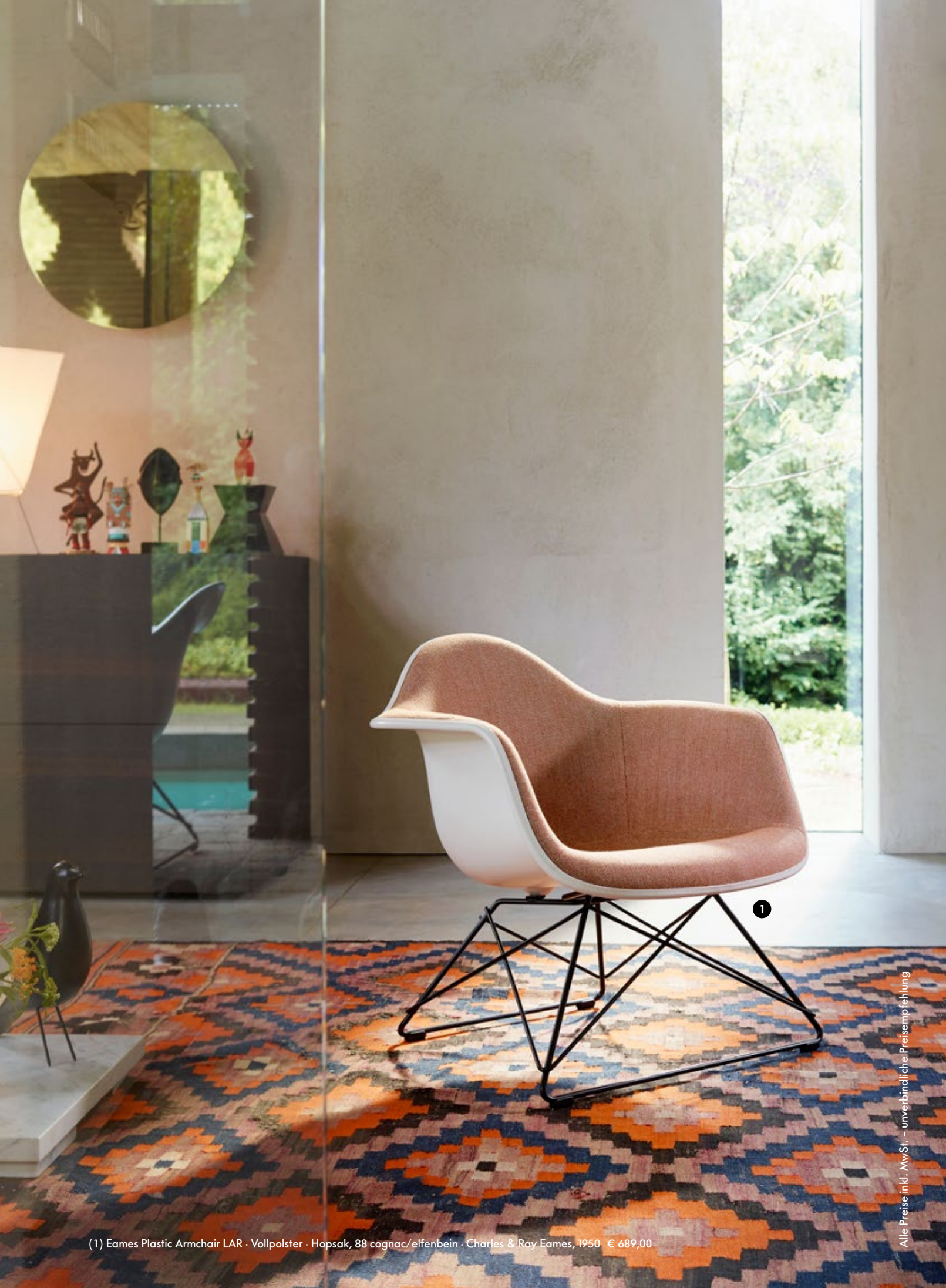
(1) Eames Plastic Armchair LAR · Vollpolster · Hopsak, 88 cognac/elfenbein · Charles & Ray Eames, 1950 € 689,00

Alle Preise inkl. MwSt. – unverbindliche Preisempfehlung