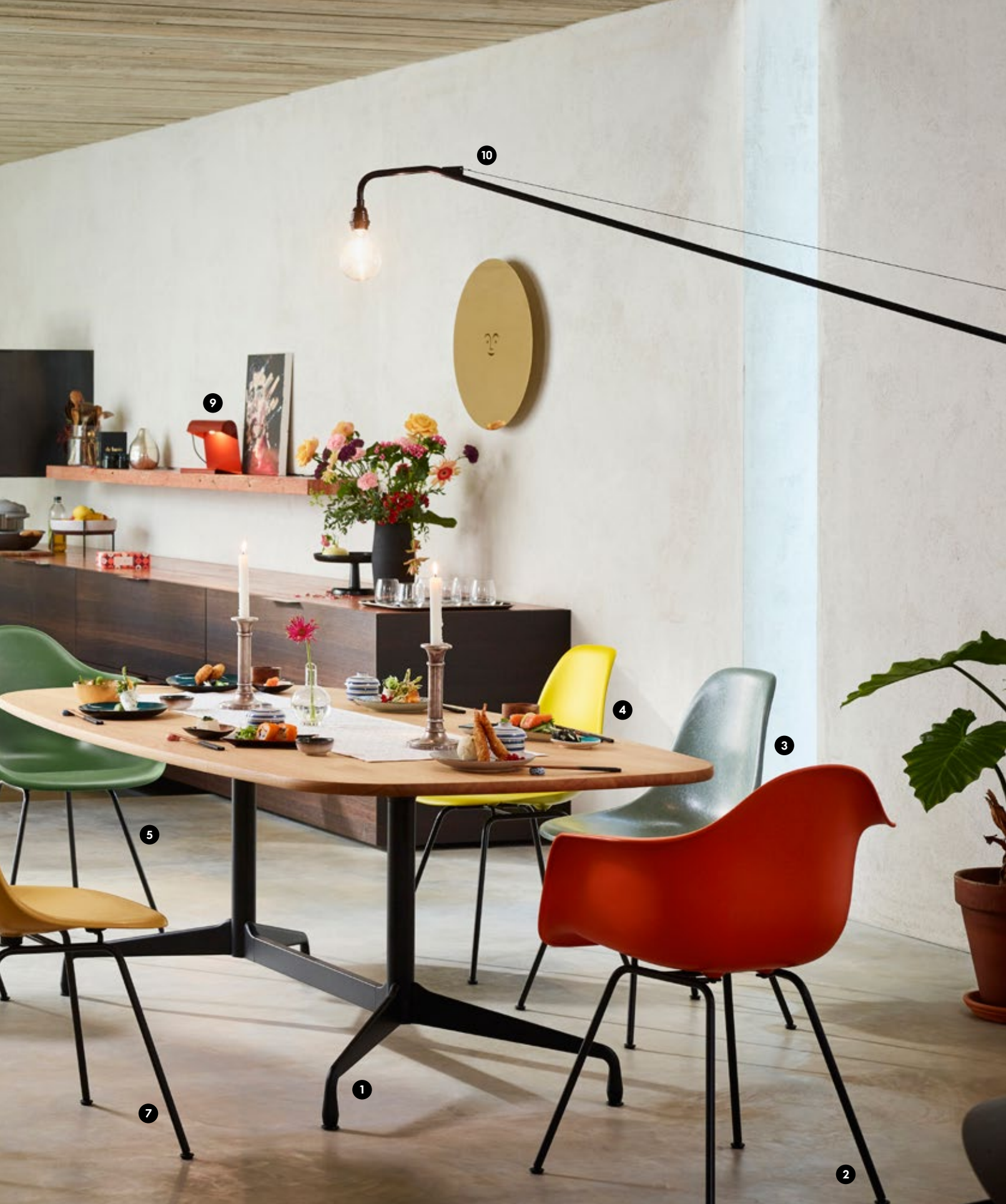
(1) Eames Segmented Tables Dining 2200 x 1100 mm · 70 Eiche natur massiv geölt · Charles & Ray Eames, 1964 € 4.660,00 (2/5) Eames Plastic Armchair DAX · 43 rostorange / 48 forest · Charles & Ray Eames, 1950 € 325,00 (3/6/7) Eames Fiberglass Side Chair DSX · 06 Eames Raw Umber / 08 Eames Ochre Dark / 07 Eames Ochre Light · Charles & Ray Eames, 1950 € 525,00 (4) Eames Plastic Side Chair DSX · 26 sunlight · Charles & Ray Eames, 1950 € 225,00 (8) Eames Plastic Armchair LAR · 04 weiss · Charles & Ray Eames, 1950 € 439,00 (9) Lampe de Bureau · 06 japanese red pulverbeschichtet (glatt) · Jean Prouvé, 1930 € 249,00 (10) Potence · 12 tiefschwarz pulverbeschichtet (glatt) · Jean Prouvé, 1950 € 1.290,00