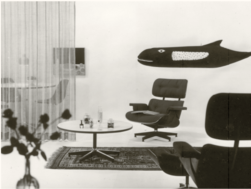
Eames Lounge Chair und Ottoman, 1956

Aus dieser Fragestellung heraus entstand ein grosszügig proportionierter Sessel, der höchsten Komfort mit hochwertigen Materialien und herausragender Handwerkskunst verbindet: der Eames Lounge Chair.