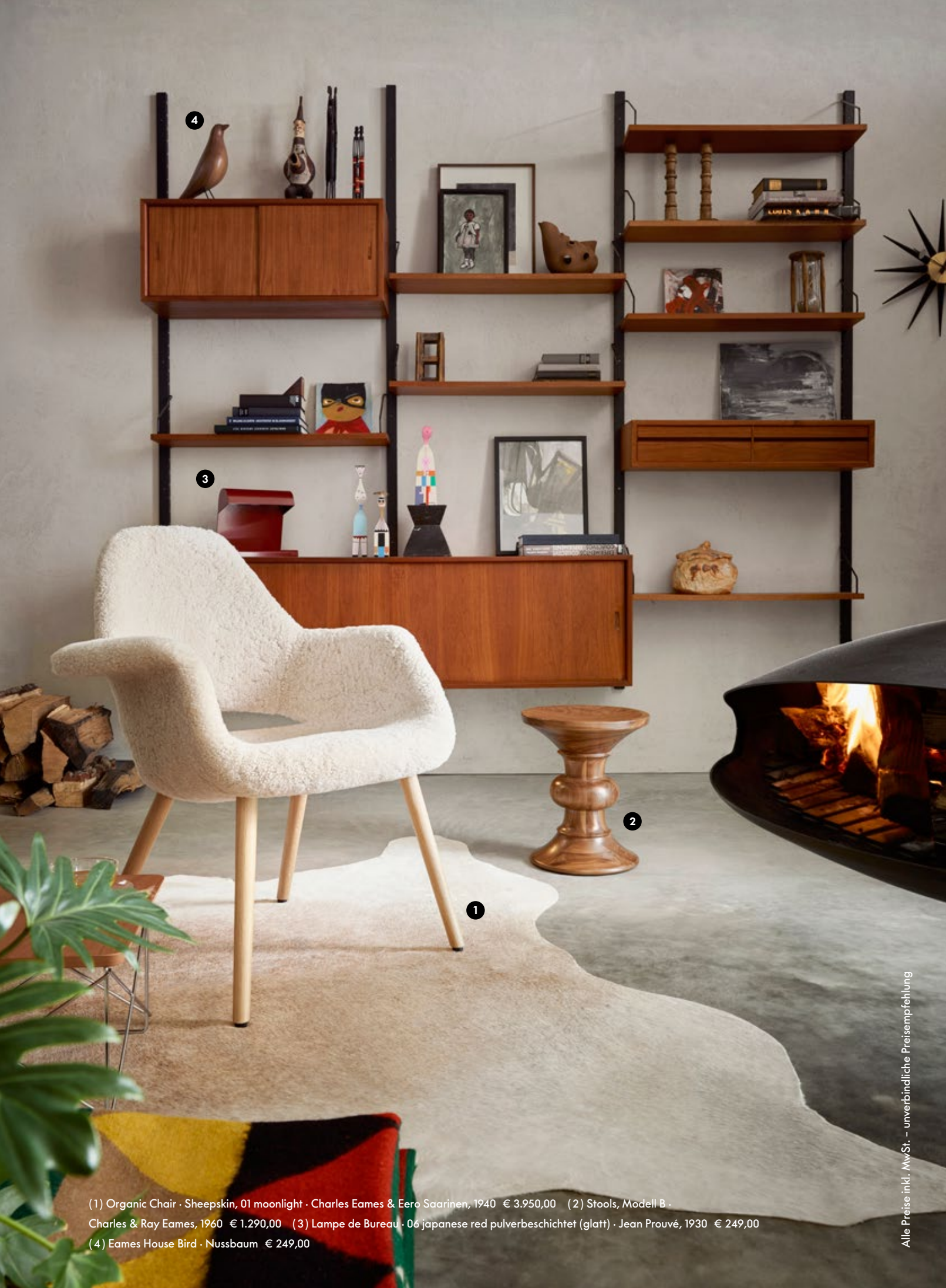
(1) Organic Chair · Sheepskin, 01 moonlight · Charles Eames & Eero Saarinen, 1940 € 3.950,00 (2) Stools, Modell B · Charles & Ray Eames, 1960 € 1.290,00 (3) Lampe de Bureau · 06 japanese red pulverbeschichtet (glatt) · Jean Prouvé, 1930 € 249,00 (4) Eames House Bird · Nussbaum € 249,00