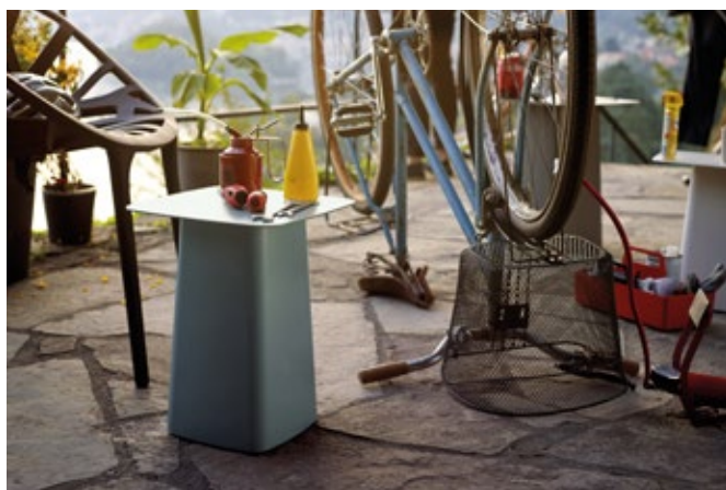
Metal Side Table (Outdoor)

Disponible en version finition époxy à structure fine, les Metal Side Tables peuvent également servir de tables d'appoint résistantes aux intempéries pour le jardin ou le balcon. Leurs nouveaux coloris s'associent parfaitement au fauteuil Waver destiné à l'intérieur et à l'extérieur, dont le piètement est disponible dans les mêmes couleurs.