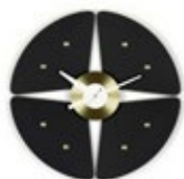
Petal Clock, schwarz/messing, Ø 450