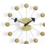
Ball Clock, Kirschbaum, Ø 330