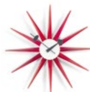
Sunburst Clock, rot, Ø 470