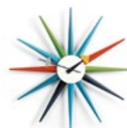
Sunburst Clock, mehrfarbig, Ø 470