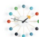
Ball Clock, mehrfarbig, Ø 330