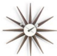
Sunburst Clock, Nussbaum, Ø 470