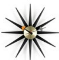
Sunburst Clock, schwarz/Messing, Ø 470